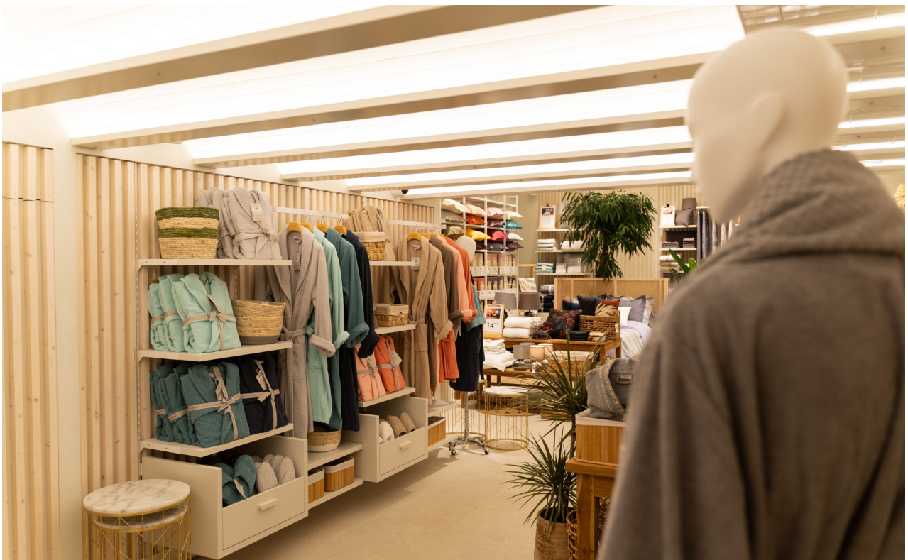
PROJECT: LA MALLORQUINA / ESTUDI FRANCESC PONS