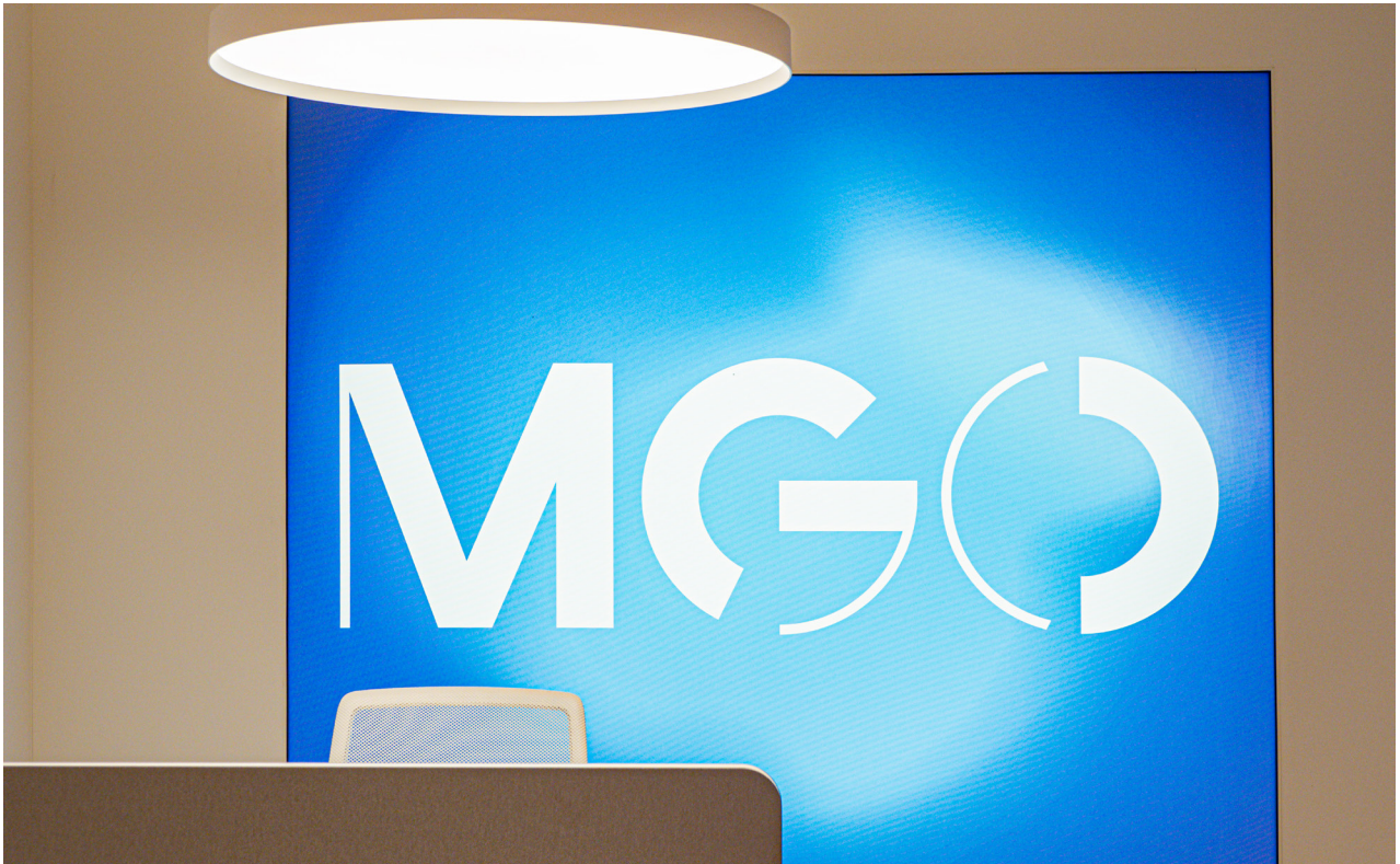
PROJECT: MGO IMMOBILIÀRIA / SANDRA SOLER STUDIO / PHOTO: JORDI CABANAS