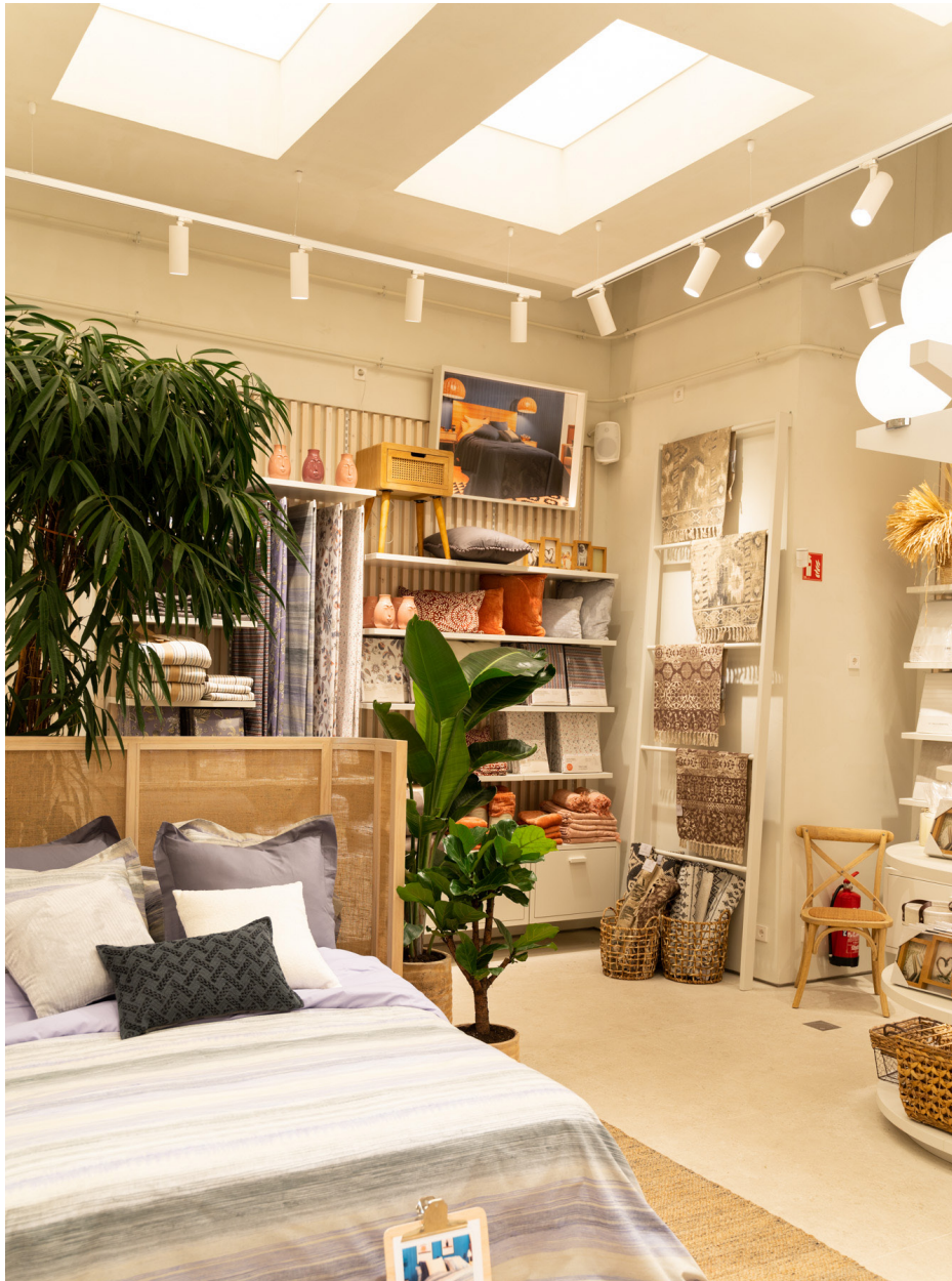
PROJECT: LA MALLORQUINA / ESTUDI FRANCESC PONS