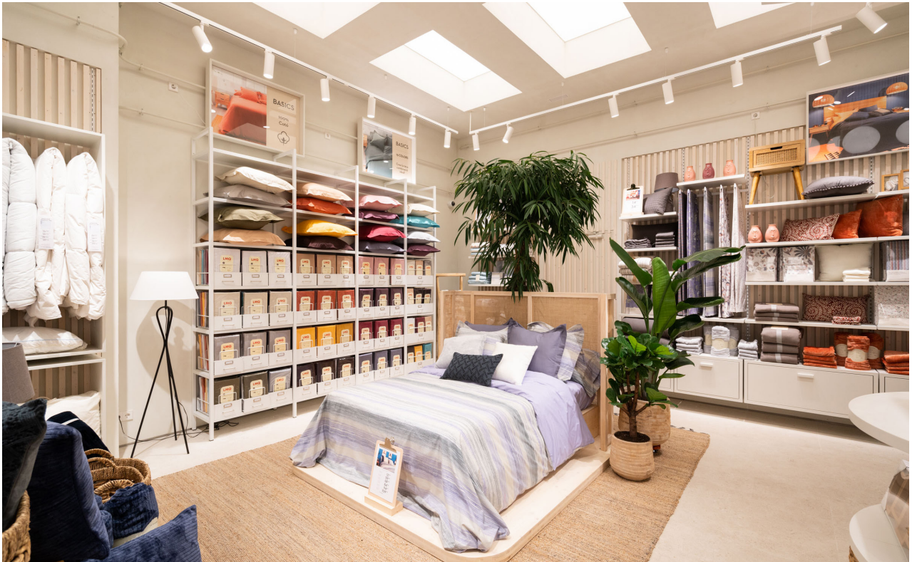
PROJECT: LA MALLORQUINA / ESTUDI FRANCESC PONS