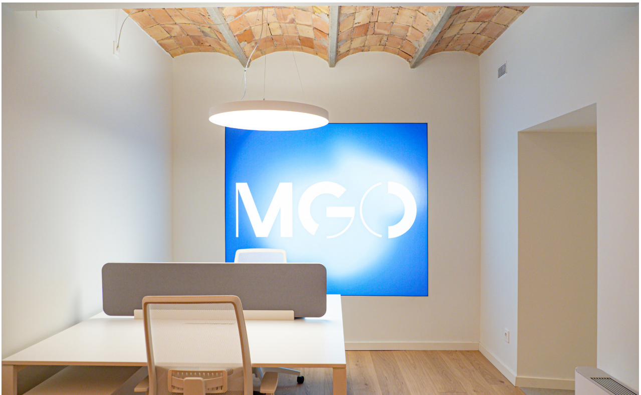
PROJECT: MGO IMMOBILIÀRIA / SANDRA SOLER STUDIO